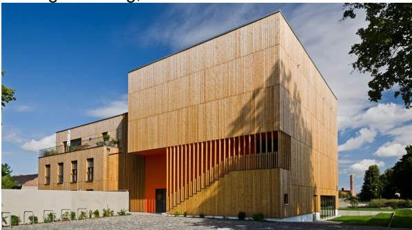
Sheridan Park: Apostelin-Junia Kirche

Die 8. Architektur und Energie Reise des Forum Energie Zürich führt uns zu unserem nördlichen Nachbarn - nach Augsburg (D). Neben vielen architektonischen und energetischen Highlights bleibt auch genügend Zeit für einen persönlichen und fachlichen Austausch unter den TeilnehmerInnen.