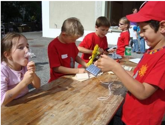
Wer gewinnt die Solarauto-Rallye?

Wo: Energiecafé, Zentrum Kafimüli (Stallikon)